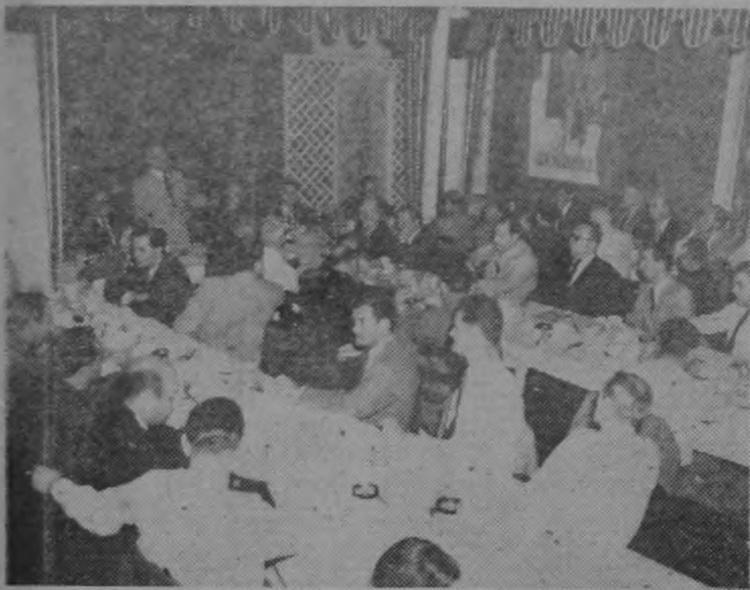
En el restaurant Chez Marcel, celebró ayer su acostumbrado almuerzo el Anglo-American Lunch Club. Miembros de esa sociedad y un grupo de invitados escucharon al señor Sandoval, de la FAO, en brillante disertación..