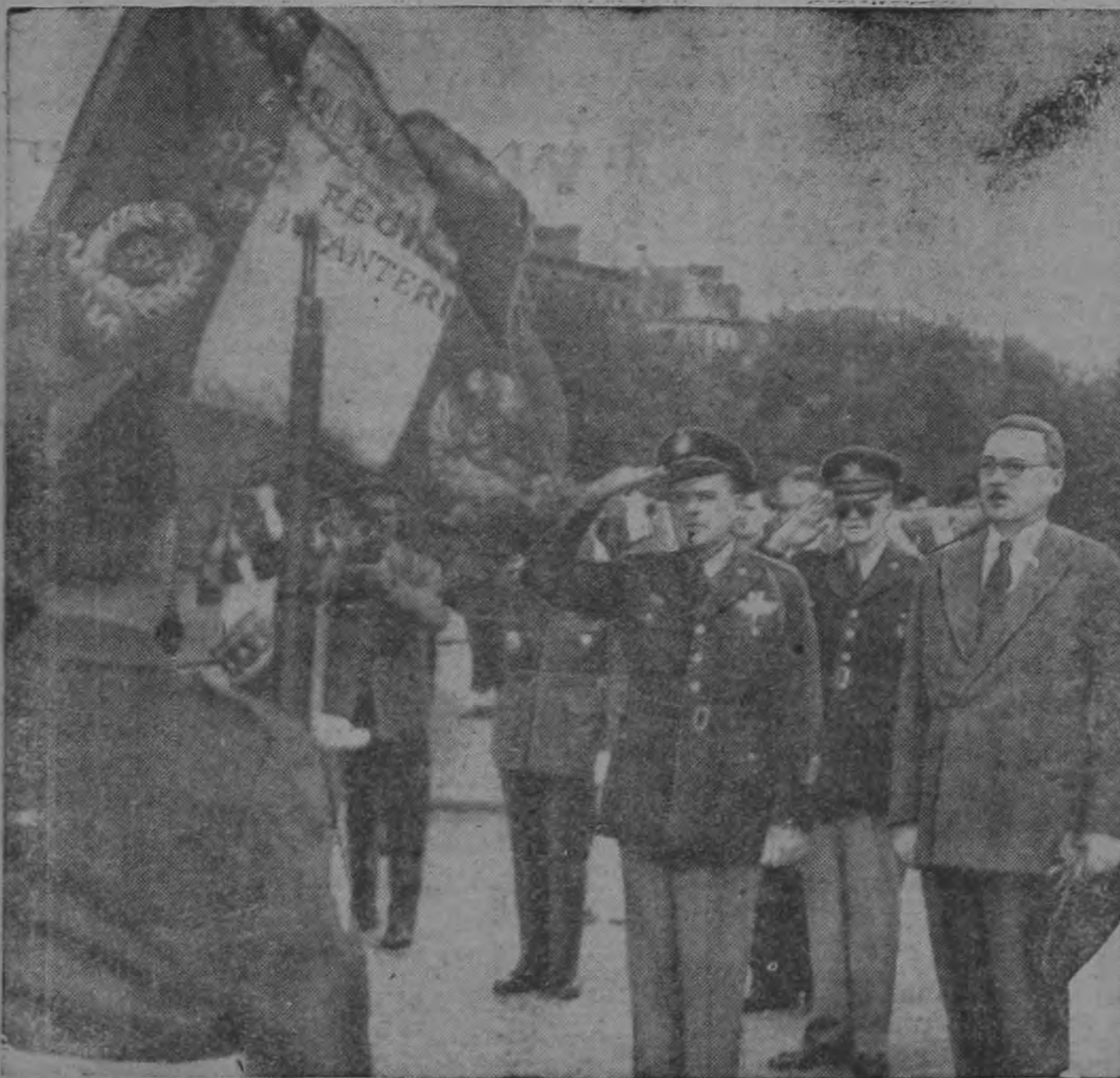
Después de colocar una corona junto a la tumba del soldado desconocido, en París el General Matthew B. Ridgway saluda el tricolor francés. A la derecha se ve al Ministro de Defensa de Francia, René Plevin. Detrás, de ellos, con anteojos negros, aparece el general Eisenhower, Comandante saliente de la Organización del Tratado del Atlántico.