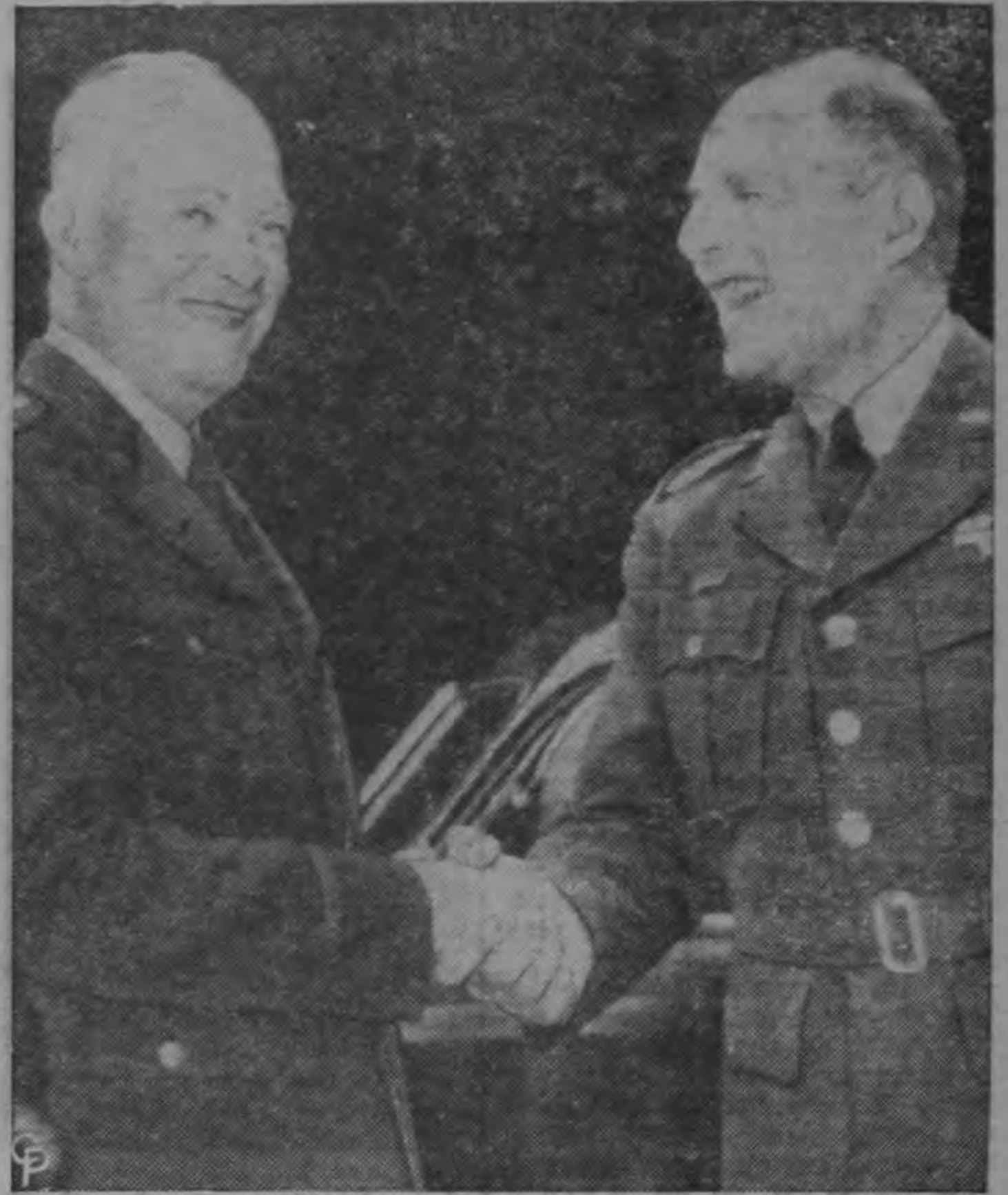
El general Dwight D. Eisenhower (izquierda) da la bienvenida al general Matthew B. Ridgway en el Palacio de Triángulo, Versalles, al llegar este último a Francia a asumir el comando de la Organización del Tratado del Atlántico del Norte.

lar preocupado siempre porque el niño reciba justa alimentación; son notables las actividades del señor Presidente de la Junta de Educación quien descurriéndose, a veces, de sus intereses personales ha puesto todo su valor en bien del progreso.