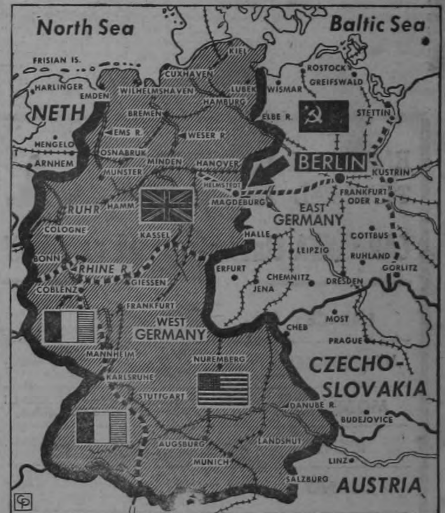
Tomando rápidas represalias después de la firma del Contrato de Paz con la Alemania Occidental, los rusos procedieron a prohibir la circulación de patrullas aliadas por la carretera principal (flecha) que une a Berlín con la Alemania Occidental. En un paso que se cree preliminar a un nuevo bloqueo de Berlín, funcionarios del Berlín oriental cortaron las comunicaciones telefónicas alegando que las líneas precisaban de "reparaciones". Toda la frontera entre la Alemania Oriental y Occidental ha sido reforzada por guardias armados rusos.